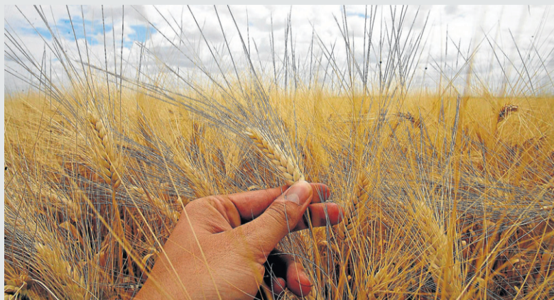
Campo de cereales en la provincia de Sevilla.

afectada. Según los productores, el daño no solo se limita a la pérdida de producción de la plaga en esta cosecha. El insecto, explican, «pasaría el verano en el rastrojo del cereal en forma de pupa con la salida de adultos en septiembre-octubre, agravando el problema para la próxima campaña». ■