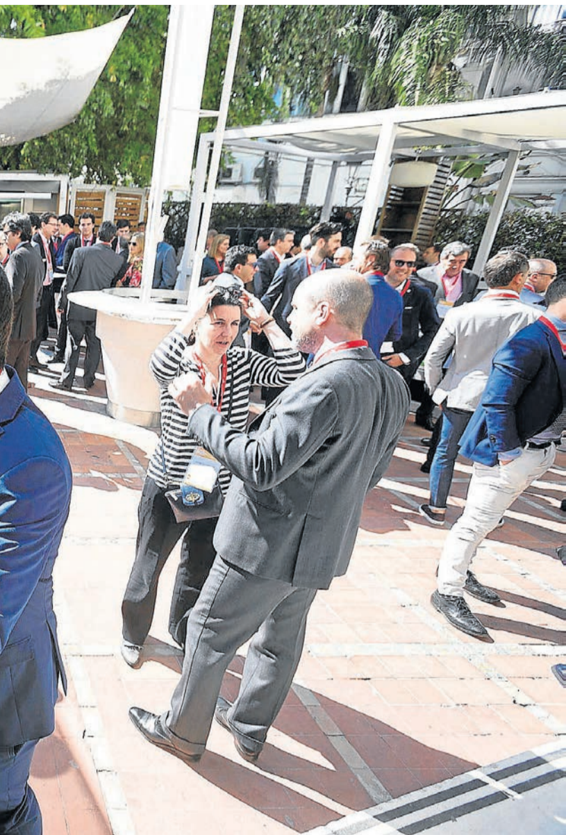
de Materias Primas en Sevilla. / Pepo Herrera

modo, Andalucía acapara el 64 por ciento de la superficie total dedicada a este cultivo.