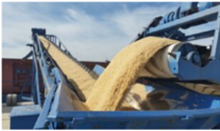
Mercancía de cereales en el Puerto de Sevilla.