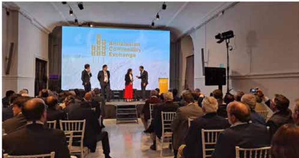
Una de las ponencias del encuentro

Sevilla, principal productora de trigo duro de España, ha acogido la XII Andalusian Commodity Exchange con la asistencia de 550 personas procedentes de 25 países