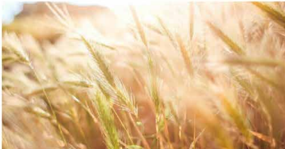
Campo de trigo / Agrónoma

El Andalusian Commodity Exchange celebrado en Sevilla también ha servido para analizar en qué punto se encuentra el mercado