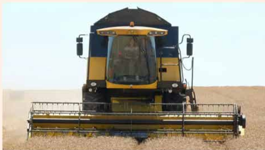
Cosecha de cereales.

La empresa sevillana les ayuda a alcanzar clientes en Europa por canales alternativos de los que Villa, por razones de seguridad, no puede ofrecer más detalles. "Es una cuestión humanitaria para que puedan conseguir el retorno del patrimonio", apunta, a la vez que lo resume así: " se trata de salir por otra puerta ".