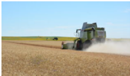
Un agricultor trabaja con una cosechadora en un campo de cereal.