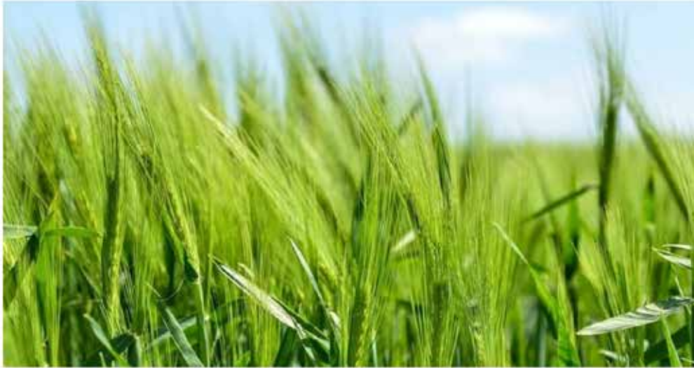
Cultivo de cebada / Agrónoma

A nivel local, la nueva campaña del cereal también se prevé, a priori, complicada debido al impacto de la sequía en los trigos, lo que posiblemente mermará los rendimientos en el campo . Y está por ver cómo quedarán las siembras de girasol tras la ampliación de las superficies a los barbechos.