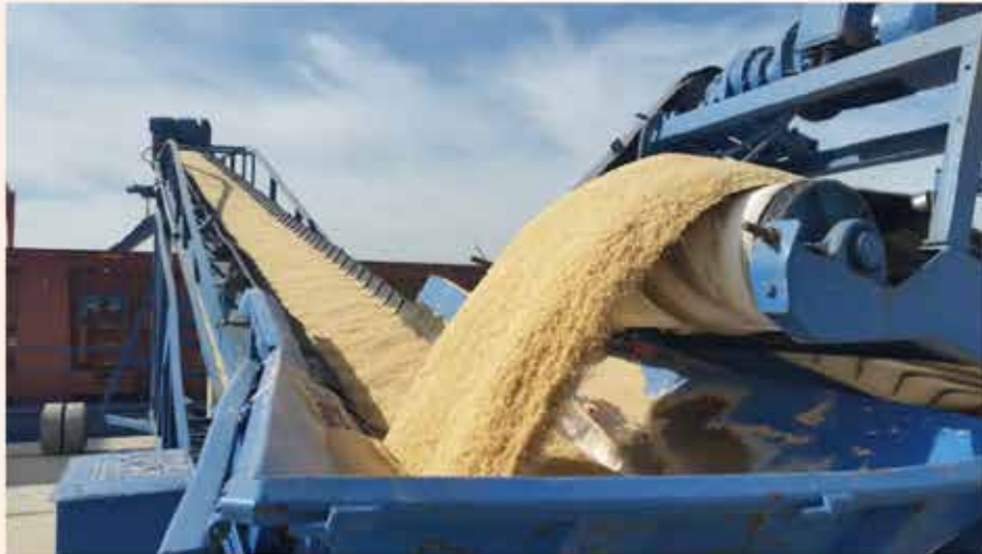
Carga de cereales.