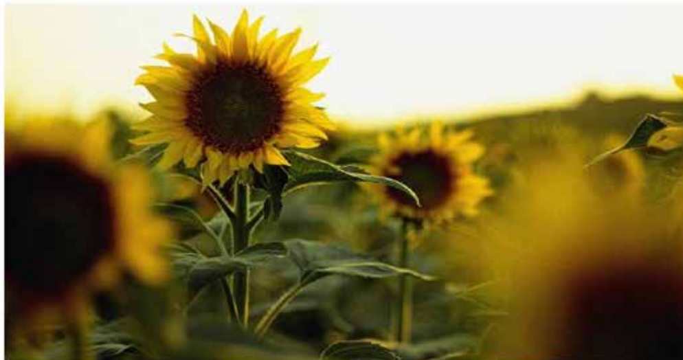
Girasol / Agrónoma