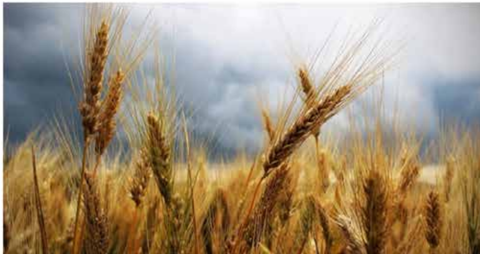
Cultivo de trigo / Agrónoma

La jornada, marcada por la inestabilidad provocada por la guerra de Ucrania y la sequía, reúne a 480 profesionales de 25 países