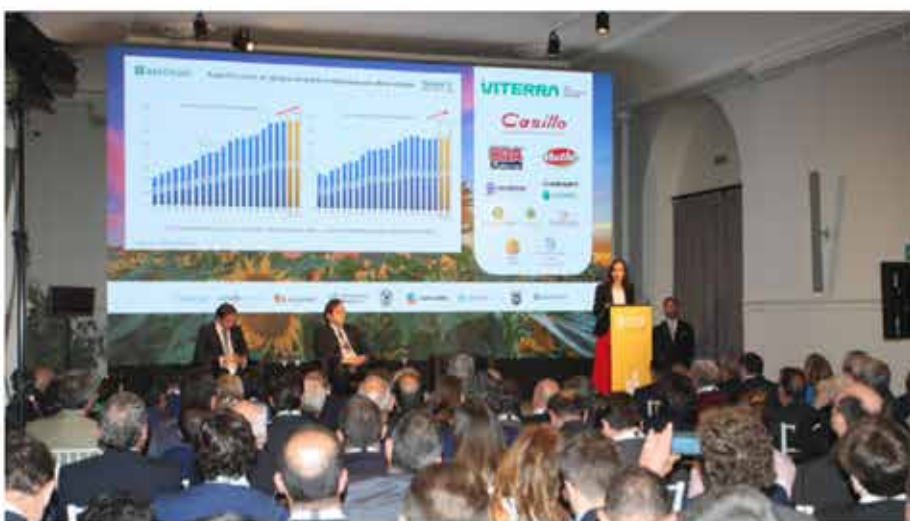
Una de las ponencias de la Andalusian Commodity Exchange celebrada en Sevilla hace unos días.

A. ESTRELLA YÁÑEZ 26 Abril, 2022 - 08:00h